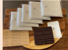
ブラックチョコレート ¥950円