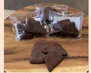
焼きミルクチョコレート 各¥302円