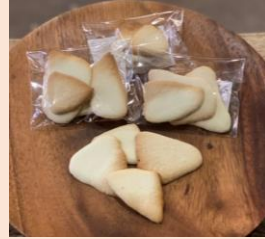
焼きホワイトチョコレート