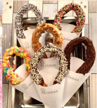
米粉の自家製チュロス