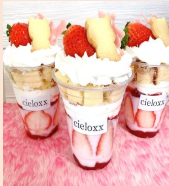
いちごのカップパフェ