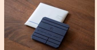
ブルーチョコレート 3,000円（税込）

出雲市大社町から話題のチョコレート専門店が再出店されます！各国のカカオ豆を厳選輸入・焙煎・粉砕・磨潰しカカオ豆からチョコレートになる工程を手作業で行っているこだわりのチョコレートをぜひご賞味ください！