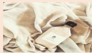
ロイヤルカカオミルクティー 700円（税込）