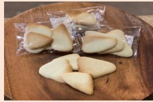
焼きホワイトチョコレート・焼きミルクチョコレート 各300円（税込）