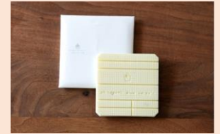
ホワイトチョコレート 1,000円（税込）