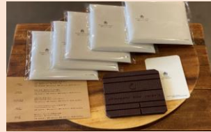
ブラックチョコレート 950円（税込）