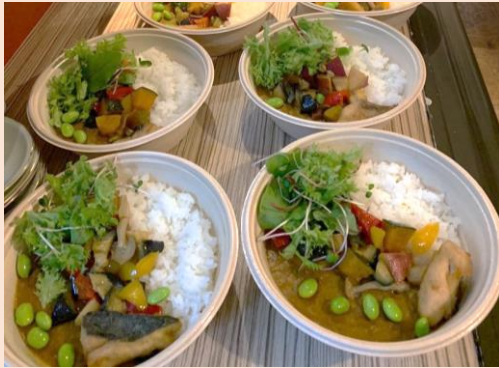
和だし魚介カレー 税込み800円

隠岐出身の店主が提供する旬の料理と選りすぐりの地酒と野球の話ができるお店「酒美人」さんが再登場です。今回は「こだわりの和出汁と旬のお魚を使用した魚介カレー」をご用意いただきます。ほかではなかなか食べることができない味のカレーですのでご期待ください！