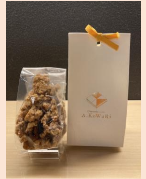
限定シューアラクレーム3個入り ￥1,296（税込） グラノーラ ￥864（税込）

松江市で大人気の洋菓子店J.KOWARIさんがきょうかいテイクアウトに初出店です。普段はイベント出店されないお店だけにこの機会にお楽しみ頂きたいと思います。当日は一つ一つ丁寧に手作りされた限定商品を販売して下さる予定です。“大切なご家族と頂くスイーツに、大切な自分へのご褒美に”ぜひお買い求め下さい。