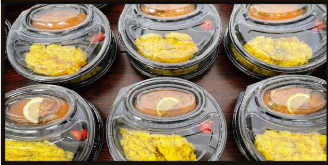
カレーライス弁当 900円(税込)

伊勢宮から少し入った所にある隠れ家的バー 「Home Bar Laugh Sketch」さんがテイクアウト コーナー初出店です！ 店主こだわりのスパイスカレーをご提供いただきま すので、是非ご賞味ください！！ 豊富なボードゲームが楽しめるお店にもぜひご来店 ください！