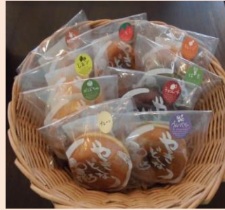
焼きドーナツ プレーン