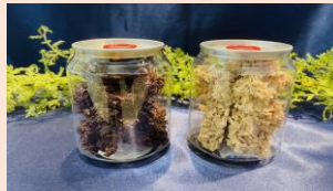
クリスピーチョコレート缶 650円（税込）