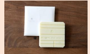
ホワイトチョコレート 1,000円（税込）