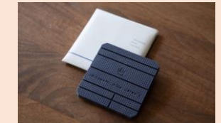
ブルーチョコレート 3,000円（税込）

出雲市大社町から話題のチョコレート専門店が再出店されます！各国のカカオ豆を厳選輸入・焙煎・粉碎・磨潰しカカオ豆からチョコレートになる工程を手作業で行っているこだわりのチョコレートをぜひご賞味ください！