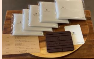
ブラックチョコレート 950円（税込）